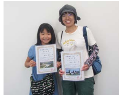
認定書交付の様子（苫田ダム）