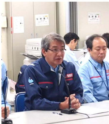
丸山局長からの訓練の指示