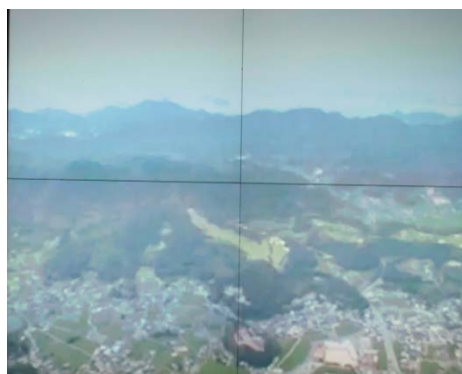
民間ヘリコプターによる被災状況調査映像