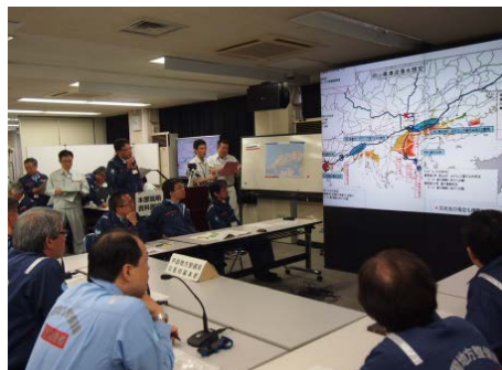
<各班からの被災状況などの報告>