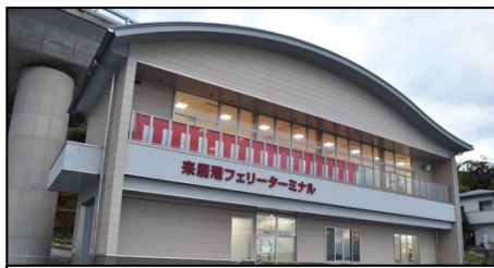
来居港フェリーターミナル