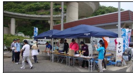
ツーデーウォーク