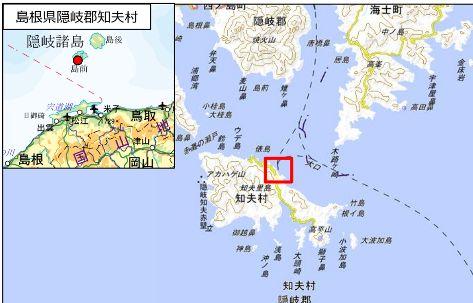
国土地理院地図（電子国土Web）( http://maps.gsi.go.jp )をもとに国土交通省作成