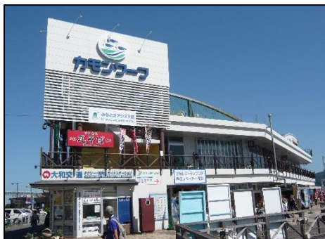
構成施設のイメージ