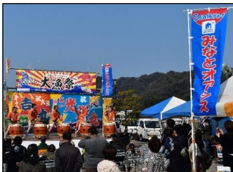
地域振興イベントの開催状況