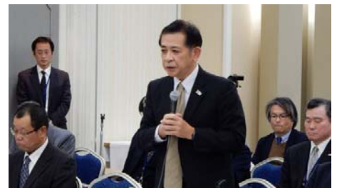
閉会の挨拶（中国運輸局長）