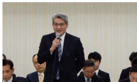
開会の挨拶（中国地方整備局長）