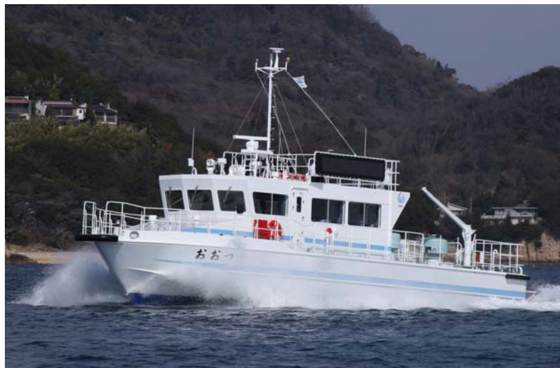
中国地方整備局所属 港湾業務艇「おおつ」