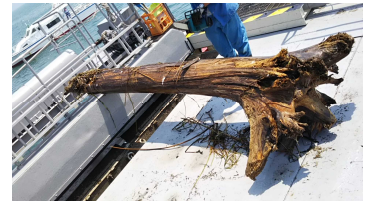
流木・葦類の回収(江田島沖合)