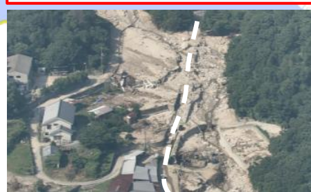
② 呉市川尻町：道路啓開支援