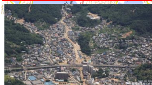
⑦ 呉市天応町：堆積土砂撤去支援