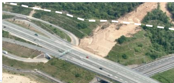
④ 東広島市高屋町：道路啓開支援