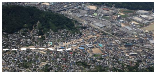
⑨ 坂町坂西：堆積土砂撤去支援