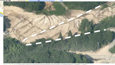
③ 呉市安浦町：道路啓開支援