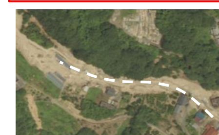
⑤ 三原市木原町：道路啓開支援