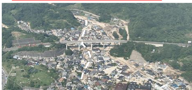
① 坂町小屋浦：道路啓開支援