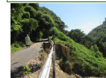
⑧ 福山市郷分町：道路啓開支援