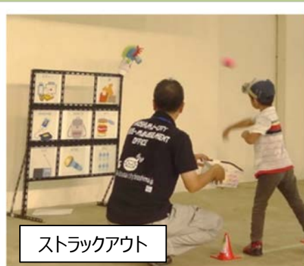
ストラックアウト