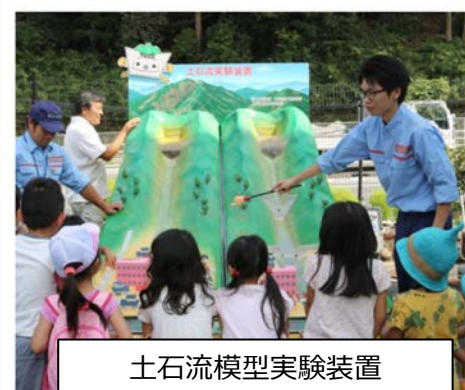
土石流模型実験装置