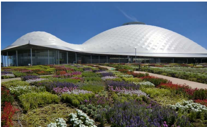
会場の山口ゆめ花博会場

主催：中国地方都市美協議会(会長市 山口県山口市 他27市町) 国土交通省中国地方整備局