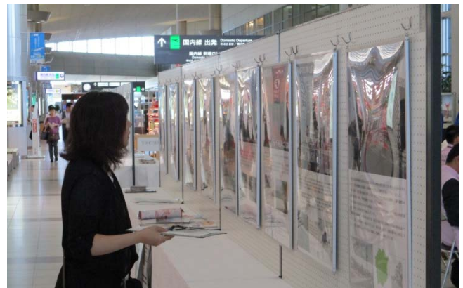
平成29年度都市景観パネル展の様子