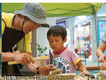
【体験コーナー】TAKE-1グランプリ