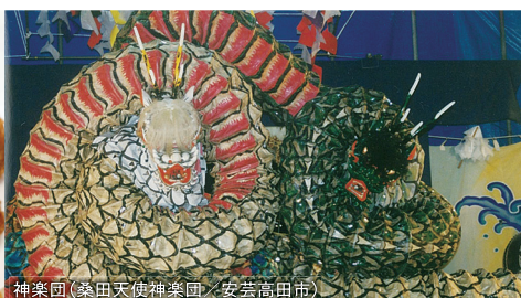
神楽団(桑田天使神楽団/安芸高田市)