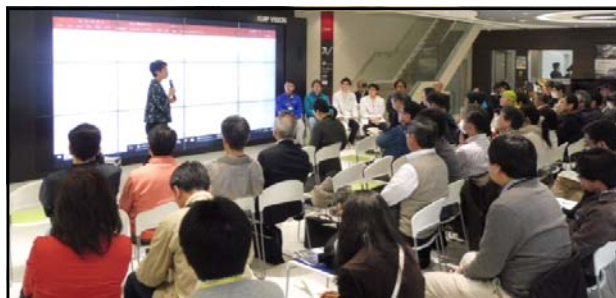
トークセッション