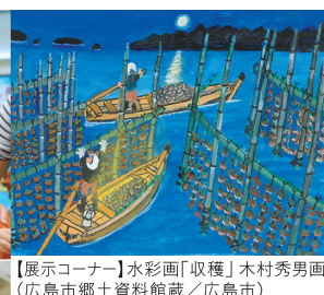
【展示コーナー】水彩画「収穫」木村秀男画(広島市郷土資料館蔵/広島市)