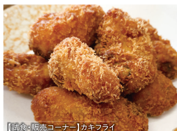
【試食・販売コーナー】カギフライ

※タイムスケジュールやイベント内容、登壇者などは予告なく変更となる場合がございます。予めご了承ください。