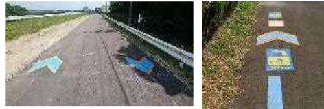
(矢羽根とルート案内)