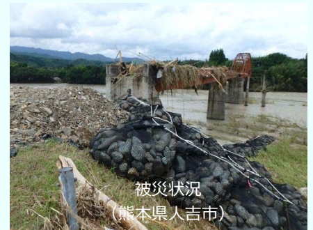
被災状況 (熊本県人吉市)