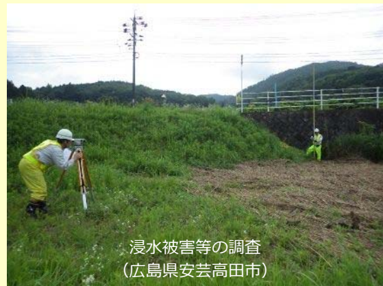
浸水被害等の調査 (広島県安芸高田市)