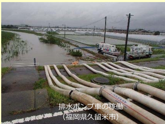
排水ポンプ車の稼働 (福岡県久留米市)