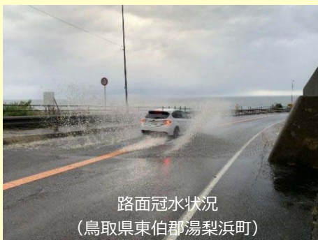
路面冠水状況 (鳥取県東伯郡湯梨浜町)