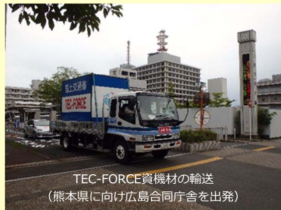
TEC-FORCE資機材の輸送 (熊本県向け広島合同庁舎を出発)