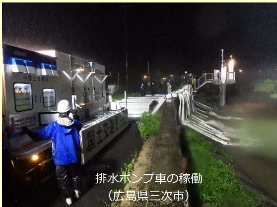
排水ポンプ車の稼働 (広島県三次市)