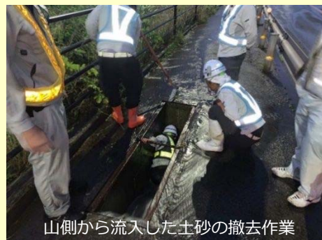
山側から流入した土砂の撤去作業