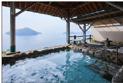
きのえ温泉からの景観（多島美）