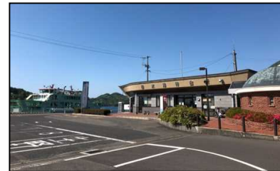
代表施設 白水港待合所