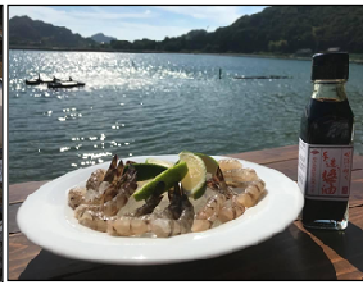
塩田熟成牡蠣と車エビ（レモンと醤油も地産）