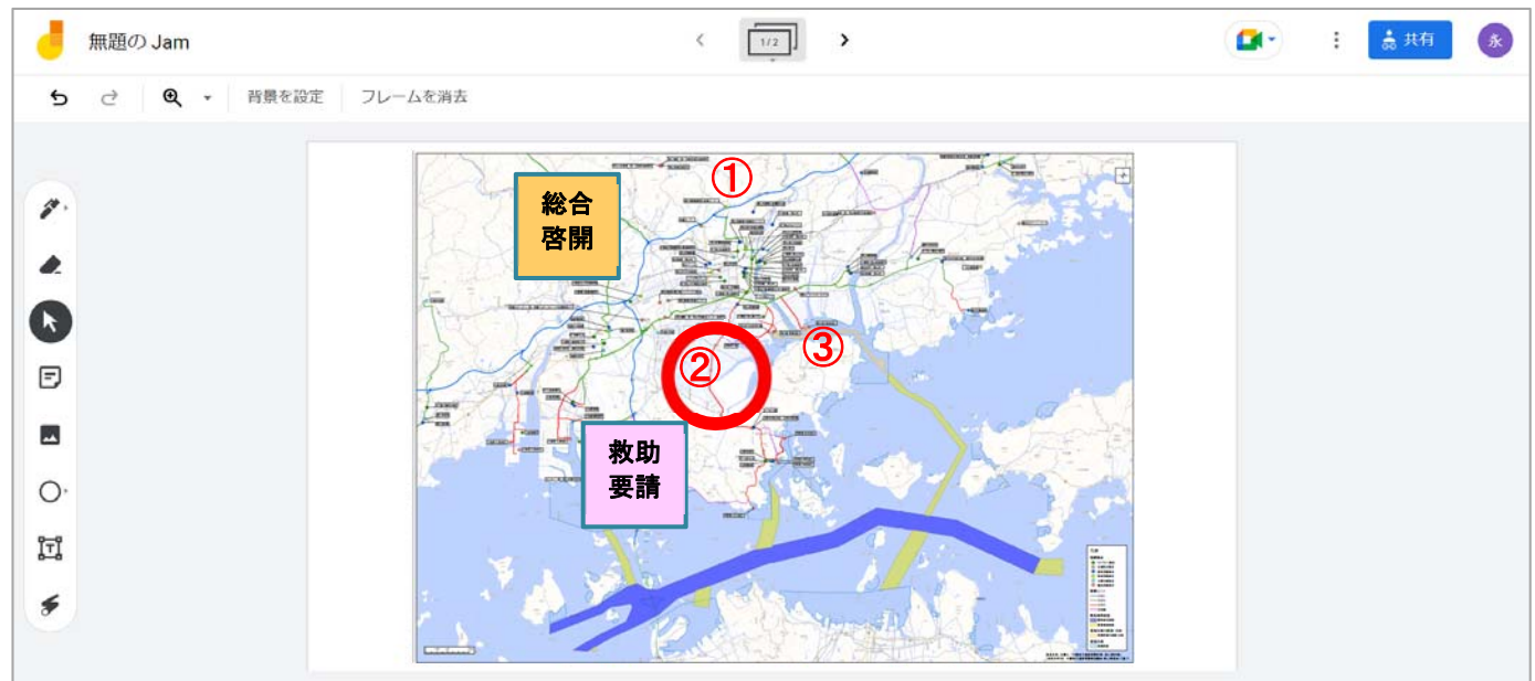
Jamboardの使用画面(大判図面上の書き込みを共有)