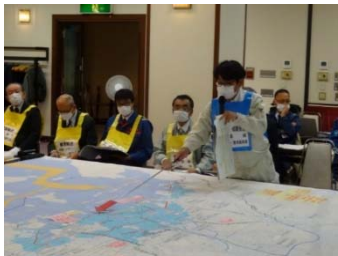
地図を用いた道路啓開 手順の説明 (R4年度)

今年度の総合啓開連携訓練では、訓練におけるDXへの取り組みとして、各機関の連携や情報収集・提供の手順確認を「Jamboard (google)」を使用、デジタル技術を活用した「WEB参加者への情報共有の高度化」、「訓練内容の視認性向上」を図る。