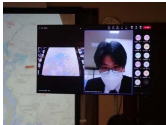
WEB参加機関による 航路啓開手順の説明 (R4年度)