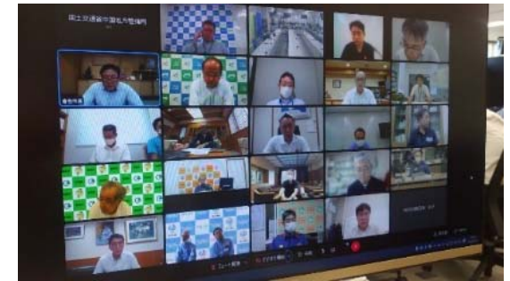
関係機関とのデジタル共有