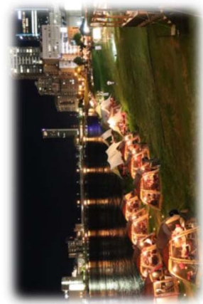
民間事業者の参加 (信濃川／新潟市)