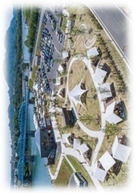
賑わい拠点の整備 (本曾川／美濃加茂市)