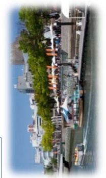
親水護岸の利用 (新町川／徳島市)