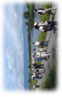
河川管理用通路の利用 (最上川／長井市)