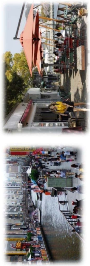
遊歩道の民間活用 (道頓堀川／大阪市)