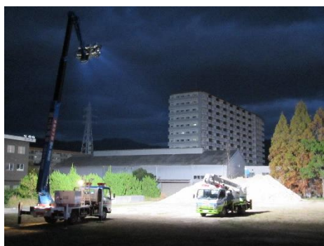
照明車の設置 （イメージ）