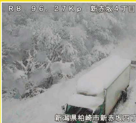
R8 96.27Kp 新赤坂4丁目