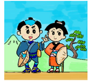
夢助くん おルネちゃん

中国地方の街道文化の魅力を発信し、街道の歴史や文化を今に伝えるためフォトコンテストを開催しました。開催にあたり、たくさんのご応募ありがとうございました。応募総数245作品の中から最優秀賞1点、特別賞7点（3点合作含む）、優秀賞10点、佳作20点の入賞作品が決定しました。入賞した皆様、おめでとうございます。