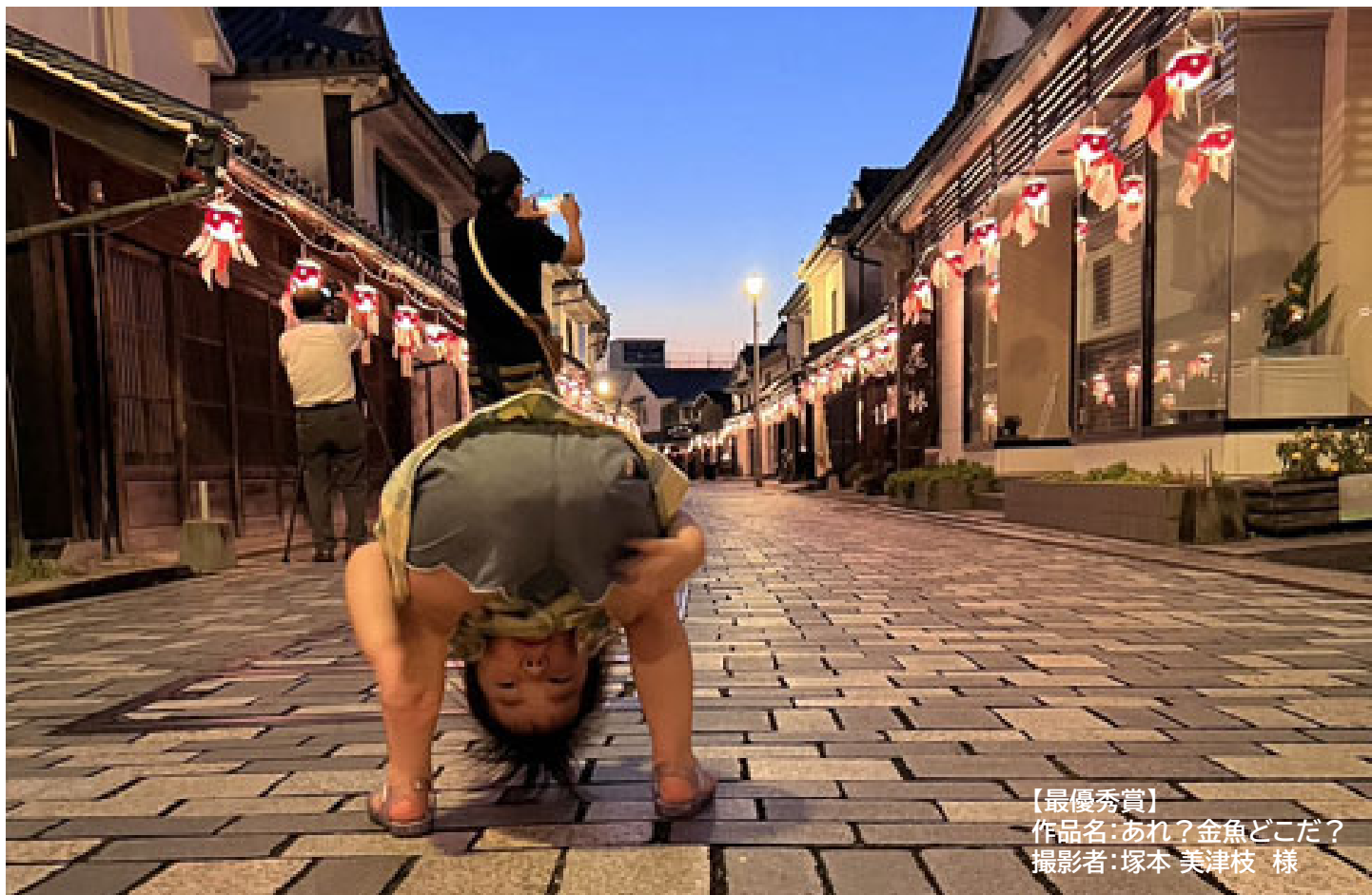
【最優秀賞】 作品名:あれ?金魚どこだ?