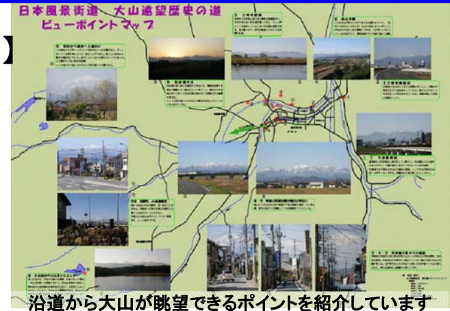
沿道から大山が眺望できるポイントを紹介しています