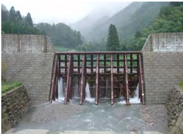
▲小泉2号砂防堰堤の土砂・流木補足状況 (2011(H23)年9月出水時)

また、天神川下流の市街地において、土砂流出に伴う河床上昇による洪水氾濫の防止・軽減を図る。