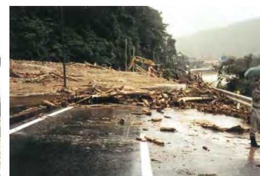
▲台風10号(1998(平成10)年) 東伯郡三朝町上西谷