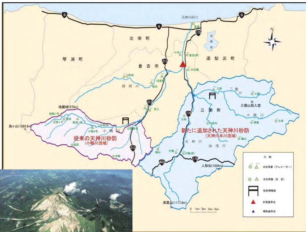
◀大山源頭部の崩壊状況