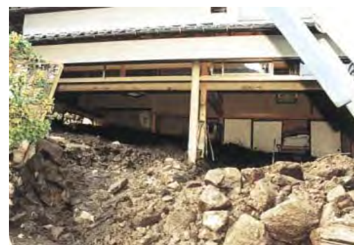
▲台風10号(1998(平成10)年) 東伯郡三朝町上西谷