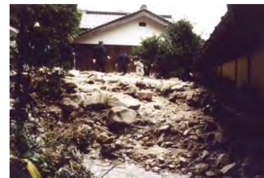
▲台風10号(1998(平成10)年) 東伯郡三朝町上西谷