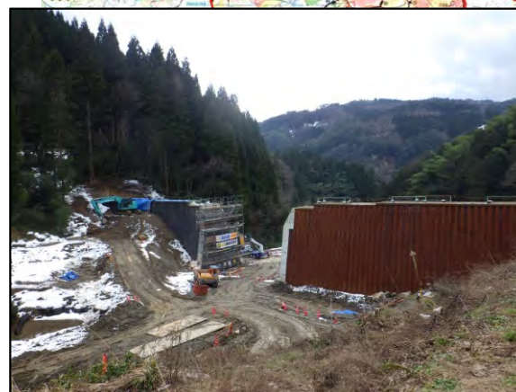
▲施工中の吉田砂防堰堤 (2018(H30)年12月)