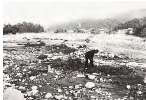
▲室戸台風(1934(昭和9)年) 倉吉市関金町関金宿