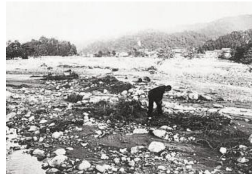
▲室戸台風(1934(昭和9)年) 倉吉市関金町関金宿