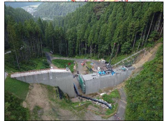
▲穴鴨4号砂防堰堤 (施工中)