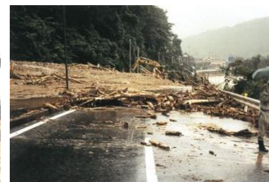
▲台風10号(1998(平成10)年) 東伯郡三朝町上西谷