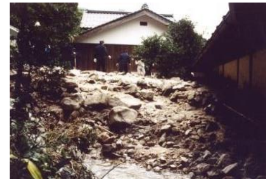
▲台風10号(1998(平成10)年) 東伯郡三朝町上西谷