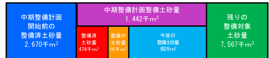
整備対象土砂量（直轄砂防）11,679千m 3