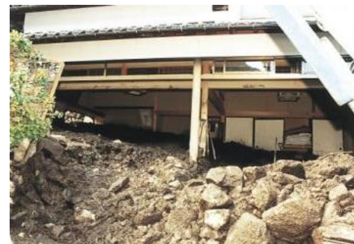
▲台風10号(1998(平成10)年) 東伯郡三朝町上西谷