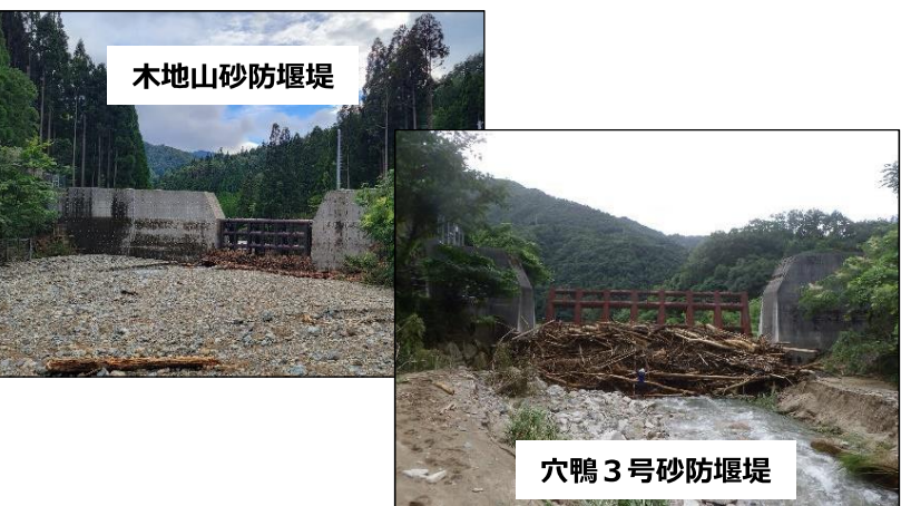
▲土砂・流木補足状況 (2023(R5)年8月台風7号)