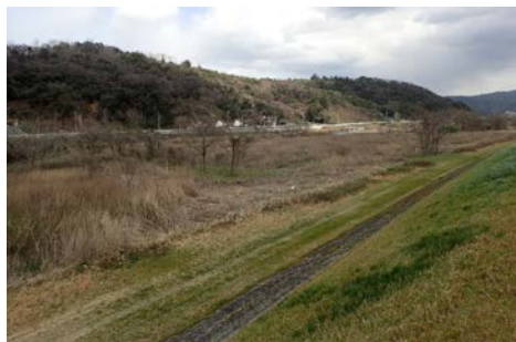
実施場所 (出口橋下流付近)