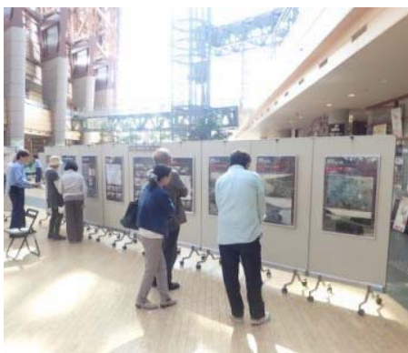
過去のパネル展示状況

過去の開催の実績 令和元年5月12日~17日 会場: 倉吉未来中心 来場者数: 約900人