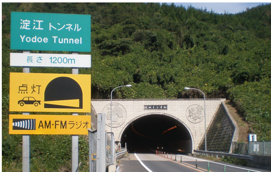
淀江トンネル (米子側坑口)