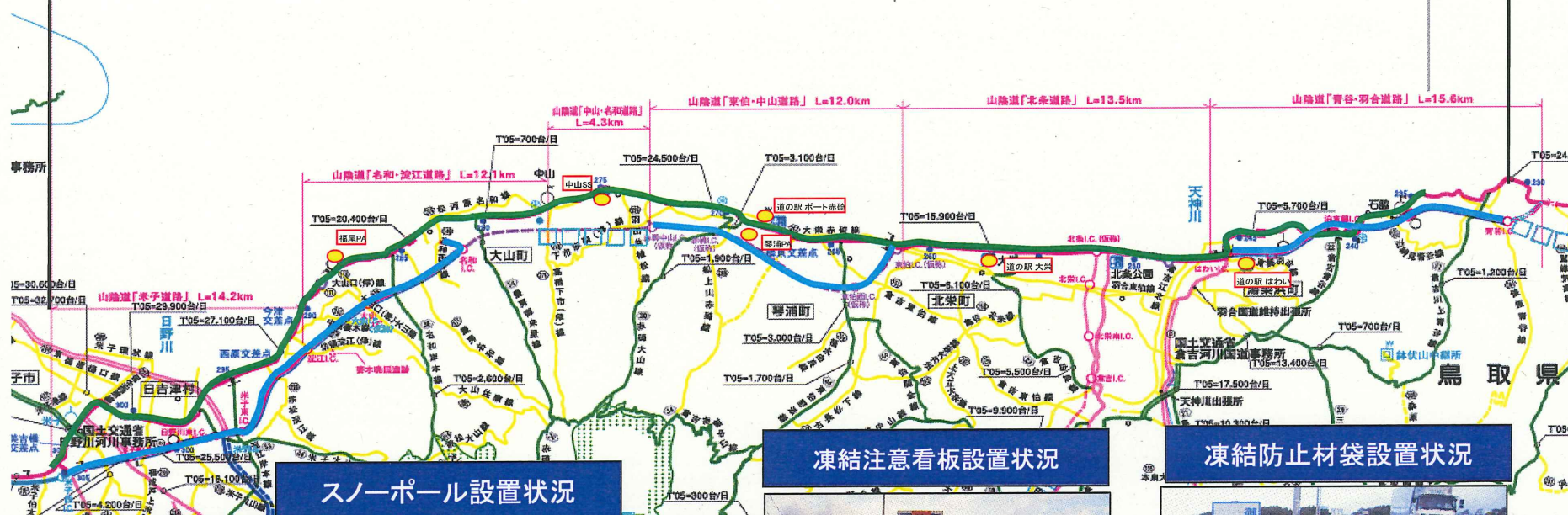
スノーポール設置状況

・スノーポール設置、チェーン着脱場看板設置、凍結防止材袋設置(橋梁前後)・・管内全域