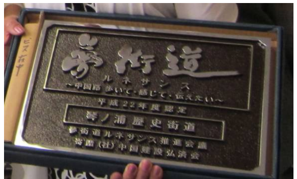
夢街道ルネサンス銘板