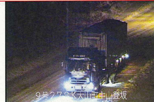
② 2012.1.24 2:40 国道9号 中山登坂