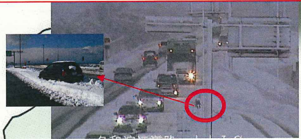
③ 2012.1.24 5:30 山陰道 大山IC下りランプ