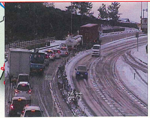
① 2012.1.5 AM 国道9号 日光坂