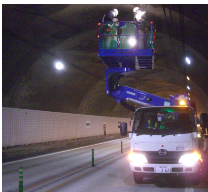
トンネル点検車にて補修作業(例)