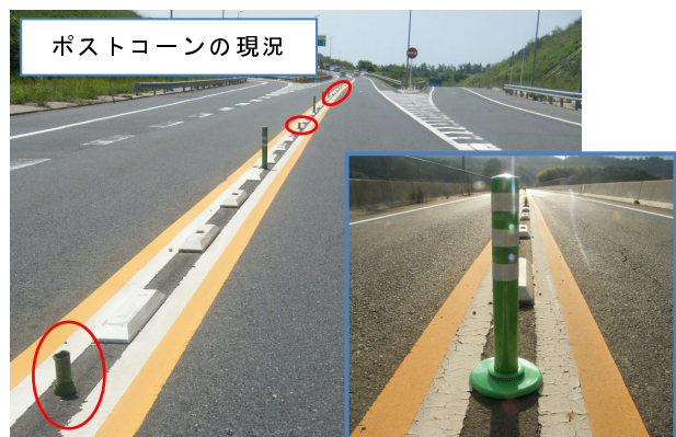
ポストコーン据付イメージ