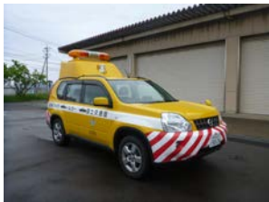
道路パトロールカー