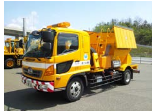
凍結防止剤散布車