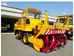
ロータリー除雪車