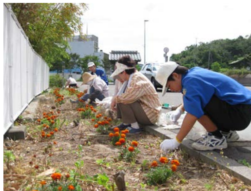
ボランティア・ロード活動