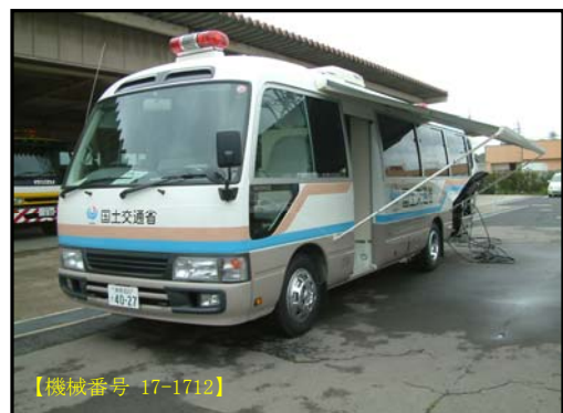
⑥ 待機支援車(バス型)