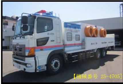
② 排水ポンプ車(30m 3 /min)揚程20m