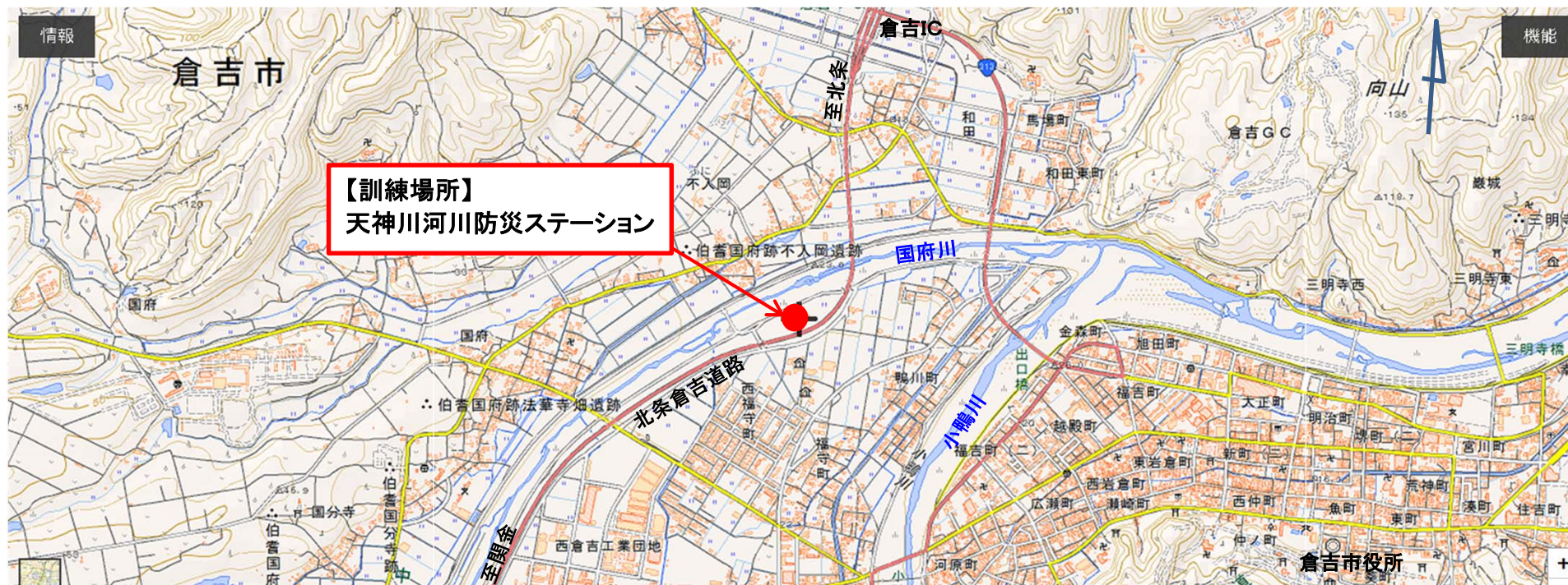
天神川河川防災ステーション位置図