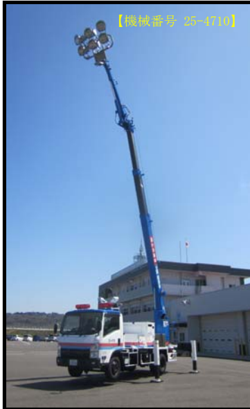
③ 照明車(ブーム式)(2kw×6灯)