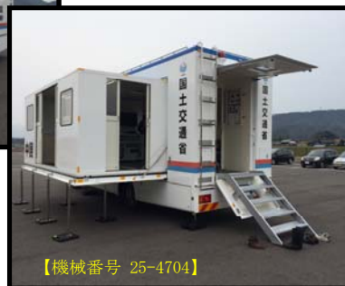
⑤ 対策本部車(拡幅型)