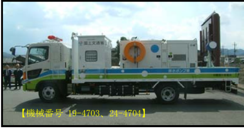
① 排水ポンプ車(30m 3 /min)超軽量型