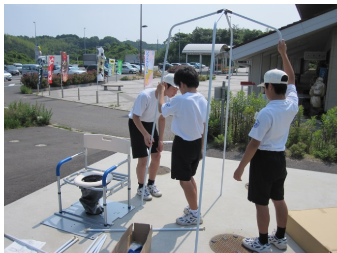
防災施設見学・設備設置体験