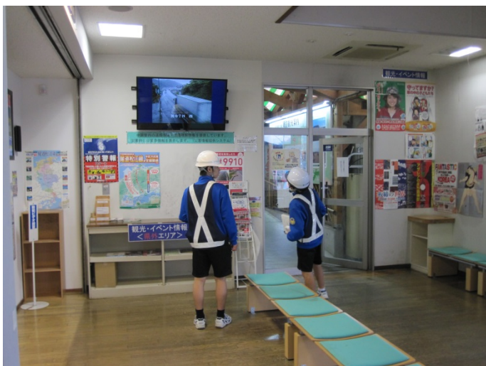
道路パトロール（道の駅巡回）