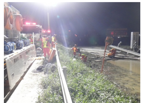
排水ポンプ車設置状況（茨城県常総市）