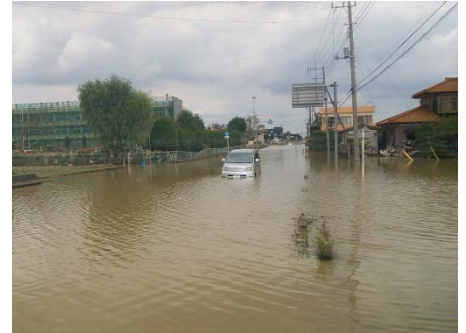
常総市立大生小学校付近の浸水被害状況

台風第18号は、9月9日10時過ぎに愛知県知多半島に上陸した後、日本海に進み、同日21時に温帯低気圧に変わった。台風第18号や台風から変わった低気圧に向かって南から湿った空気が流れ込んだ影響で、西日本から北日本にかけての広い範囲で大雨となった。特に関東地方と東北地方では記録的な大雨となり、この豪雨により河川のはん濫や浸水、土砂災害など多くの被害が発生し、栃木県や茨城県、宮城県では特別警報が発表された。