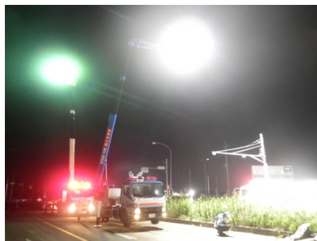
照明作業状況（茨城県常総市）