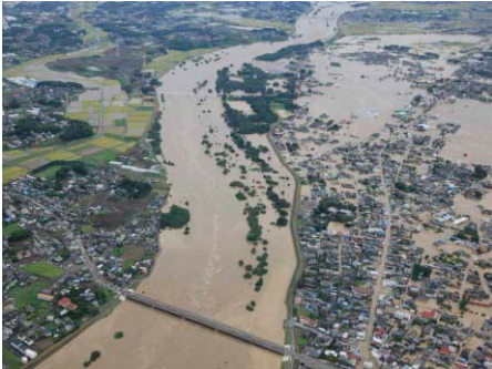
浸水被害状況（茨城県常総市）

平成27年9月の関東・東北豪雨では関東地方で発生した災害に対し地域の建設業者の皆さまには、休日、夜間などの急な要請にも係わらず、迅速・的確な応急対策などの対応を頂いた。