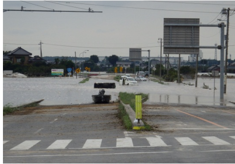
国道354号 浸水被害状況（茨城県常総市）