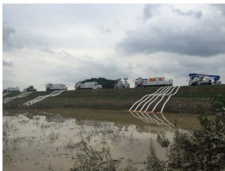
排水作業状況（茨城県常総市）

この大雨の影響で利根川水系鬼怒川の堤防が決壊し広域的な浸水被害が発生したため、中国地方整備局からの要請により倉吉河川国道事務所からは排水ポンプ車2台、照明車2台を派遣し、応急対策及び応急復旧に大きく貢献した。