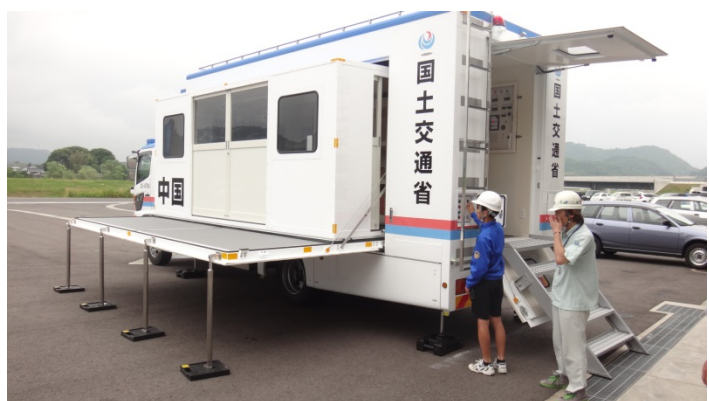
災害対策車両操作