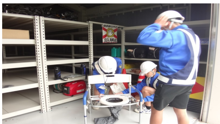
防災施設見学・設備設置体験