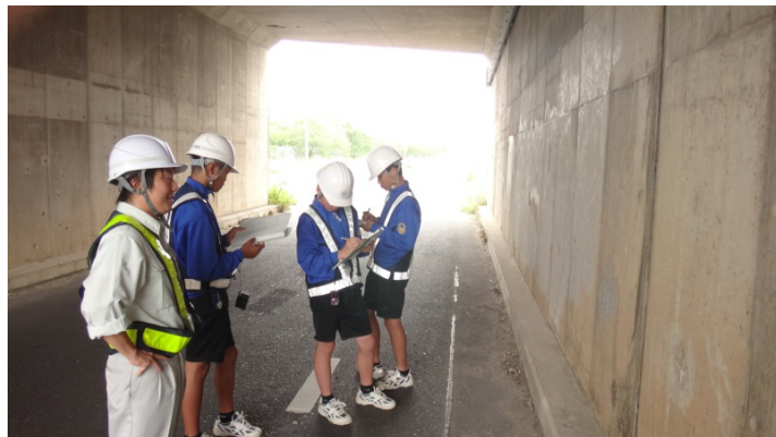
道路パトロール（構造物点検）