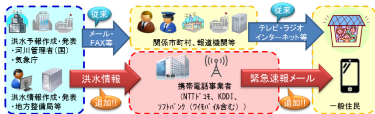
「洪水情報のプッシュ型配信」イメージ

ワイモバイル： http://www.ymobile.jp/service/urgent_mail/