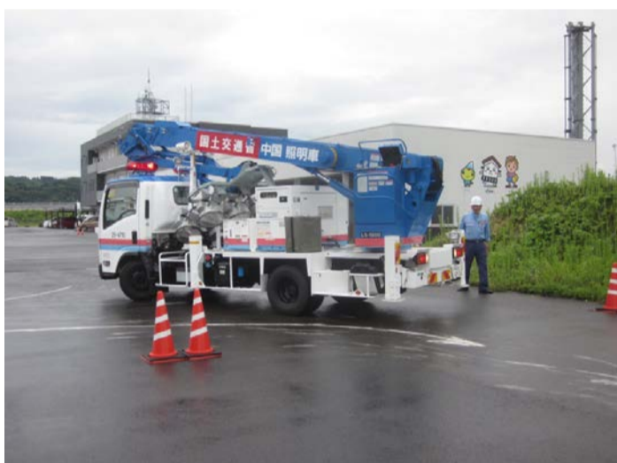
実地訓練状況(照明車)