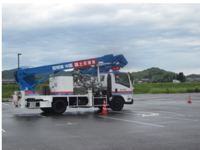
実地訓練状況(照明車)