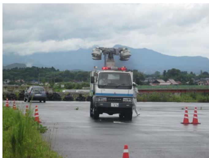
実地訓練状況(照明車)