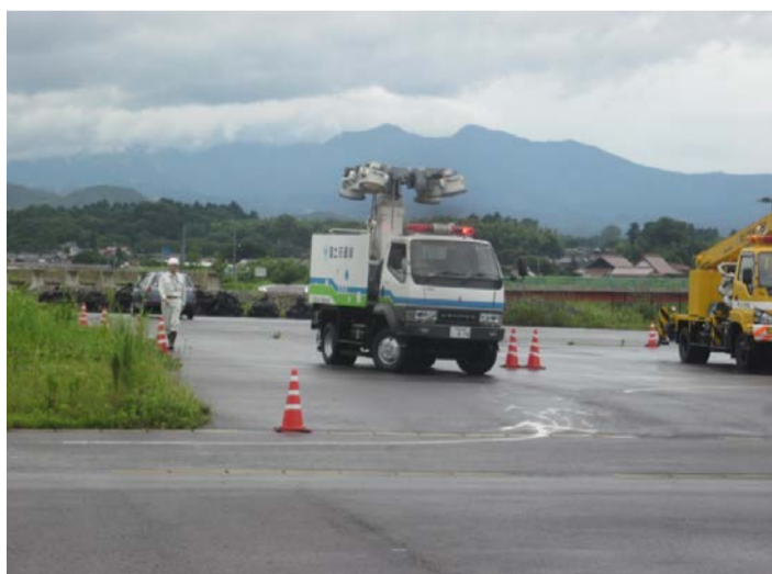
実地訓練状況(照明車)