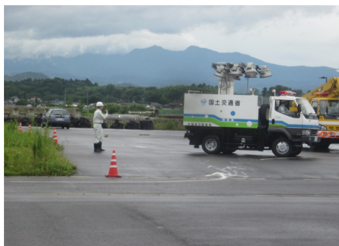
実地訓練状況(照明車)