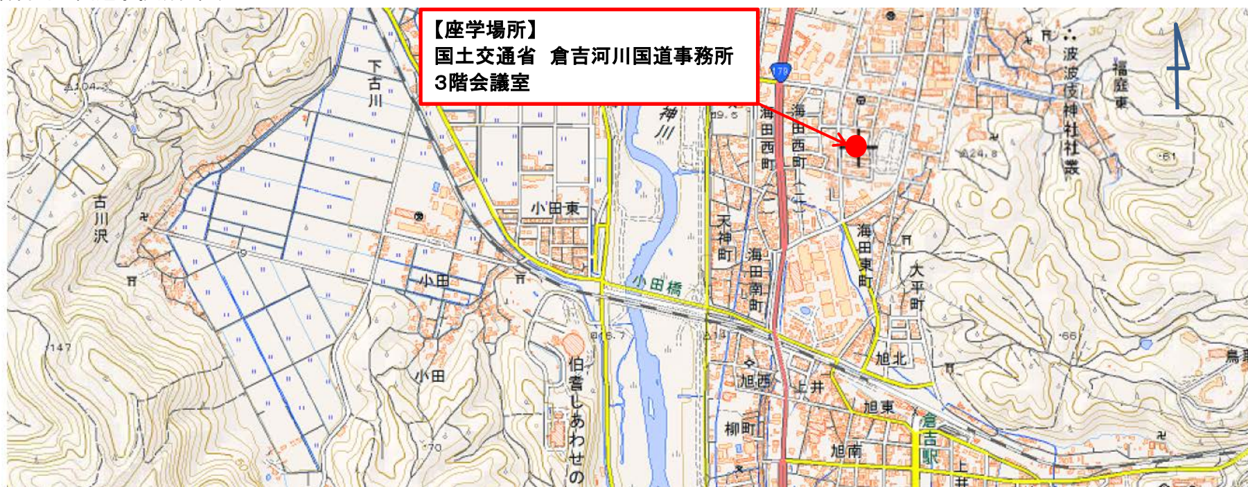
倉吉河川国道事務所位置図