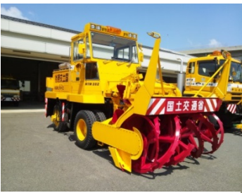
ロータリー除雪車