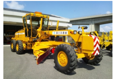
除雪グレーダ (試乗予定)