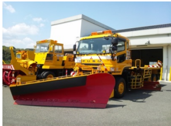
除雪トラック (試乗予定)