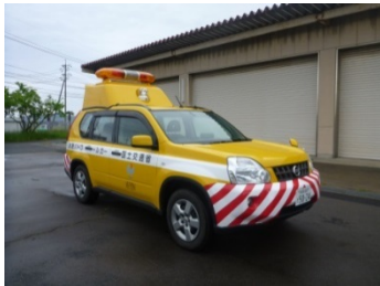
道路パトロールカー (試乗予定)