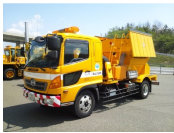
凍結防止剤散布車