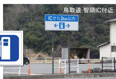
▲設置事例(鳥取自動車道)