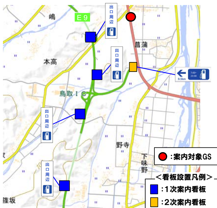
電子国土基本図(国土地理院)を元に鳥取河川国道事務所作成