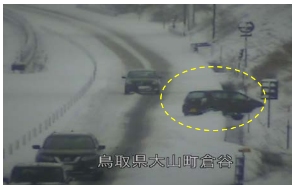
鳥取県大山町倉谷