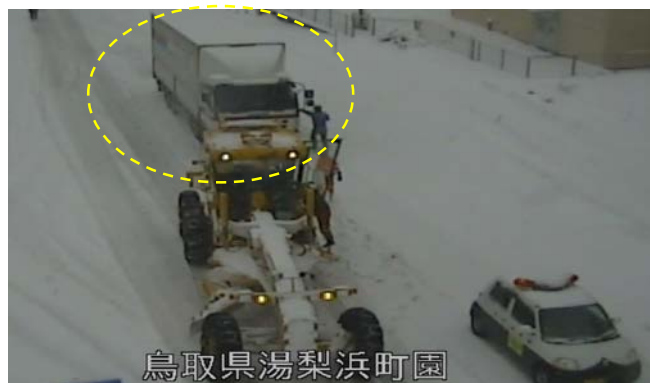
鳥取県湯梨浜町園