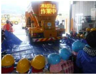
凍結防止剤散布実演