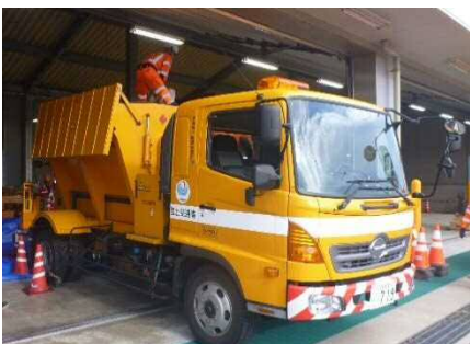
凍結防止剤散布車 （凍結防止剤散布実演予定）