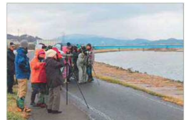
過去の観察会の様子

日 時：令和4年1月23日（日）（予備日：30日（日）） 午前8時 ～ 午前9時 場 所：北野神社対岸付近 参加資格：定員20名（先着順） 申込締切：令和4年1月6日（木）17時まで 申込方法：郵送、FAX、メール 参加費：無料