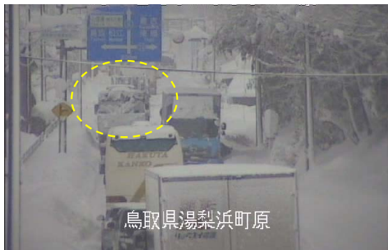
鳥取県湯梨浜町原