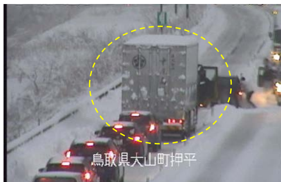
鳥取県大山町押平