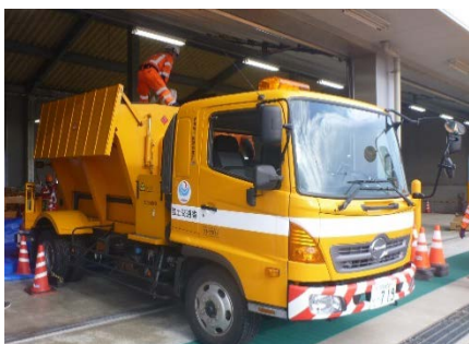
凍結防止剤散布車 （凍結防止剤散布実演予定）