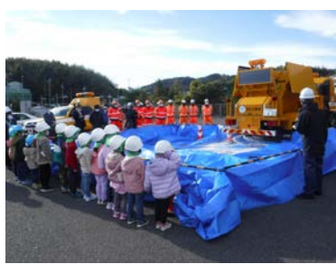
凍結防止剤散布実演