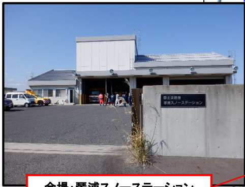
会場：琴浦スノーステーション