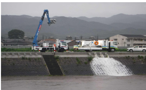
令和3年7月7日 内水排除 (梅雨前線による) (倉吉市西福守地先 国府川不入岡排水樋門) 排水ポンプ車 (24-4704)、照明車 (R01-4704)