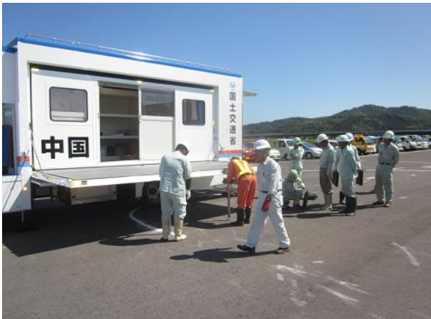
対策本部車設置訓練状況