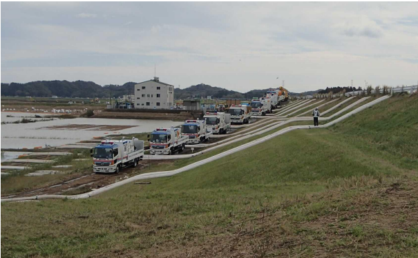
令和元年10月13日 内水排除 (台風19号災害による) (宮城県石巻市地先) 排水ポンプ車3台 (19-4703, 25-4705, 25-4710)