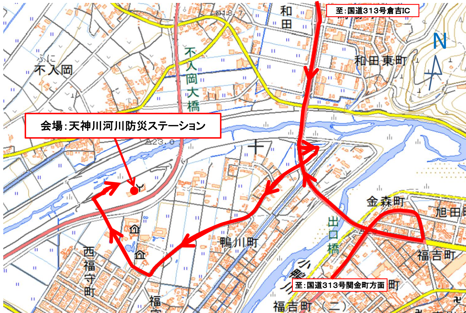
会場(天神川河川防災ステーション位置図)