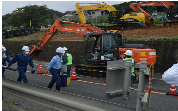
令和3年8月20日 国道9号 (380k700～800付近) において、令和3年 8月18日に発生した地すべり (島根県出雲市多伎町地内) 簡易遠隔操縦装置 (ロボQs) (R02-1715) 設置バックホウ