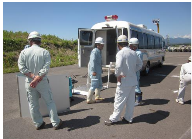
待機支援車設置訓練状況