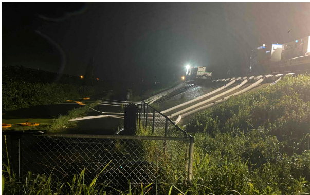
令和5年8月15日 内水排除 (台風7号災害による) (倉吉市西福守地先 国府川不入岡排水樋門) 排水ポンプ車 (R01-4701)、照明車 (R01-4704)