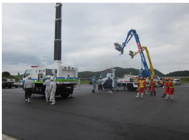
照明車設置訓練状況