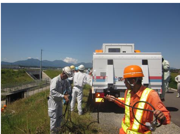
排水ポンプ車 排水訓練状況