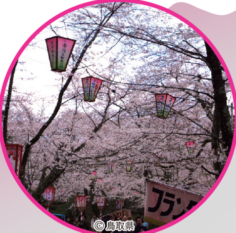
① 打吹山・打吹公園