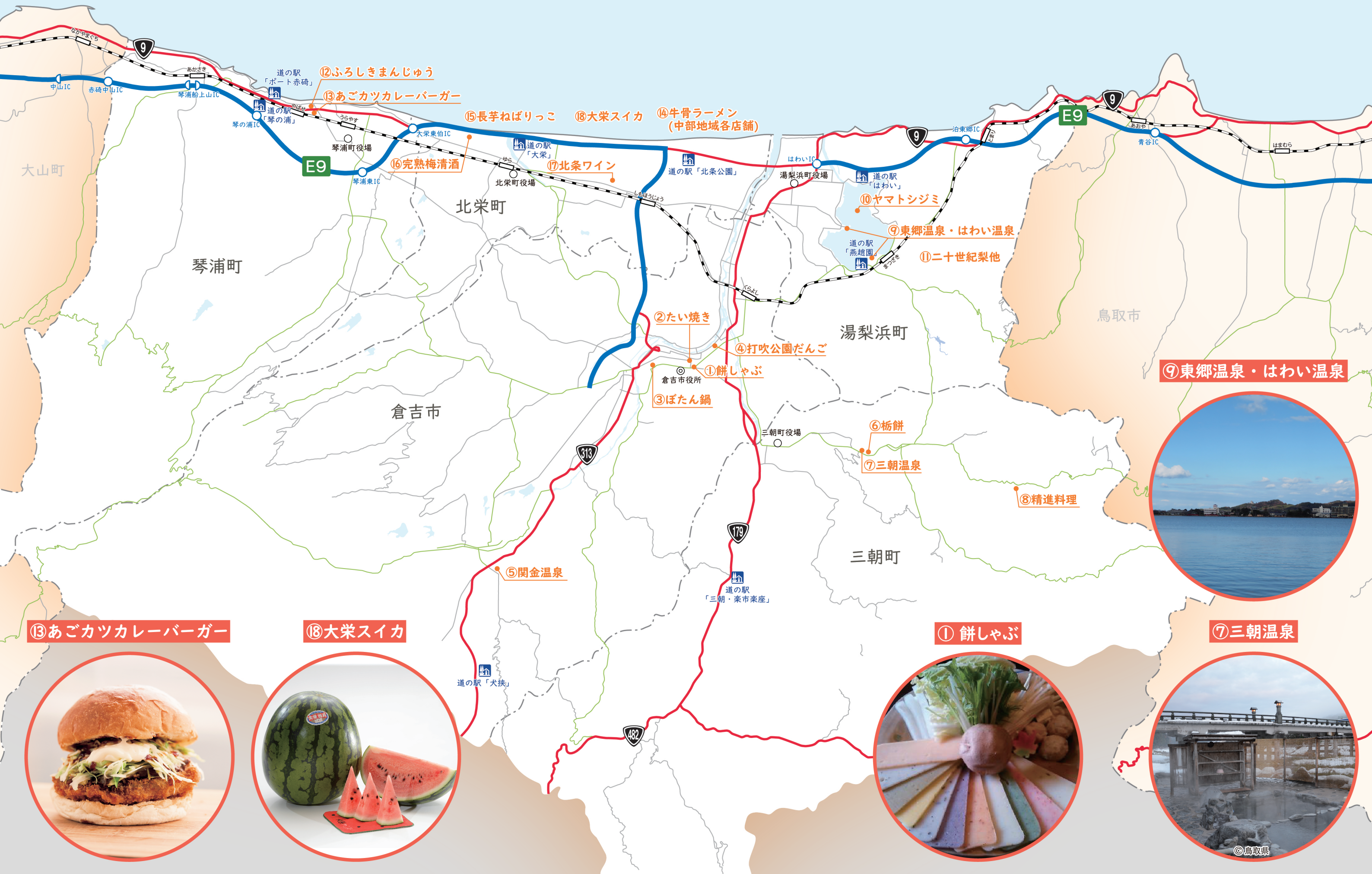
13 あごカツカレーバーガー