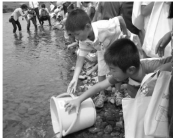
7月14日に行われた開校式 鮎を放流する子供たち