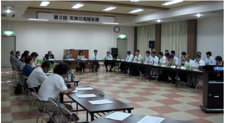
天神川流域会議 会員名簿