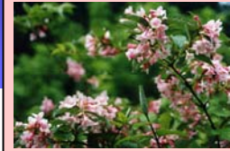
天神川の花 タニウツギ

6月24日（水）、三朝町総合文化ホールにて、第3回天神川流域会議を開催しました。