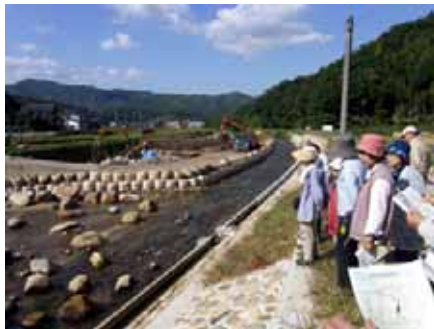
▲加茂川改修事業の説明 加茂川の改修も今年度で全て終わるそうです。