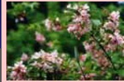
天神川の花 タニウツギ