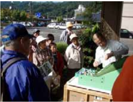
▲模型を使って砂防事業の説明 土石流が発生するしくみや、砂防堰堤の働きや効果についての勉強です。

当日は天候に恵まれ、参加者26名の方々に、河川・砂防事業に対する理解を深めていただきました。