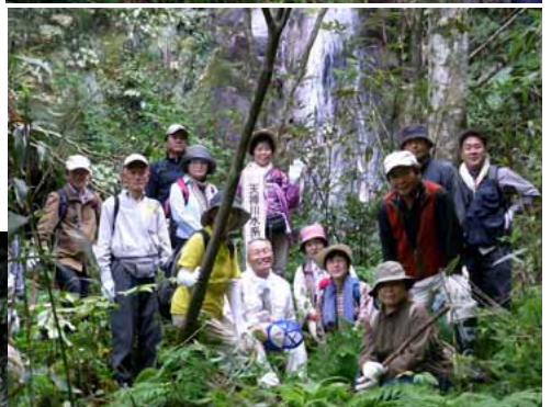
▲滝の前で記念撮影

加茂川源流付近にある滝の前で記念撮影です。流域観察会は、「全国豊かな海づくり大会」(H23)の協賛事業に登録しました。希望された方には「白うさぎ大使」として大会の広報をお願いしています。