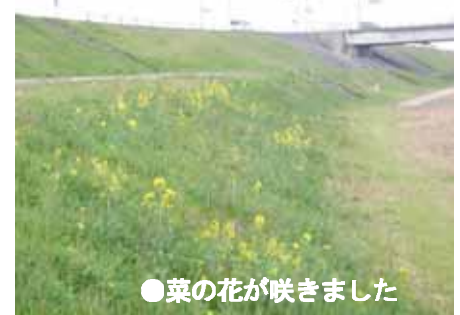
●菜の花が咲きました