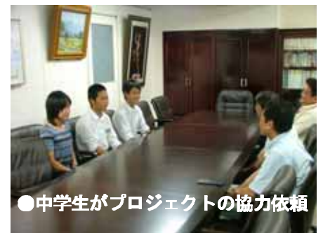
●中学生がプロジェクトの協力依頼